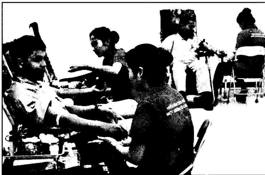
NLCLC là những người không chỉ có trình độ khoa học, công nghệ mà còn là những NLD giàu văn hóa, nhân ái, vì cộng đồng. Trong ảnh, cán bộ, công nhân Công ty Kyocera Hưng Yên tham gia hiến máu tình nguyện

Nghị quyết Đại hội XIII của Đảng tiếp tục khẳng định xây dựng và phát huy giá trị văn hóa, sức mạnh con người Việt Nam; đổi mới căn bản, toàn diện giáo dục và đào tạo, nâng cao chất lượng nguồn nhân lực (CLNNL), phát triển con người. Mục tiêu xây dựng và phát triển văn hóa (PTVH) cũng là mục tiêu xây dựng và phát triển con người mới Việt Nam, đặt con người vào vị trí trung tâm của chiến lược phát triển kinh tế - xã hội, đồng thời là chủ thể của sự phát triển.